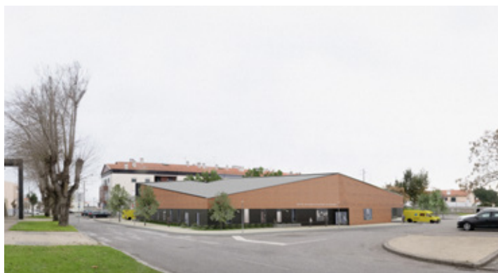
Extensão de Saúde da Gafanha da Nazaré, Simulação 3D

Focados na promoção de estilos de vidas saudáveis em todas as faixas etárias, o Município de Ílhavo irá aplicar 1,3 milhões de euros na atividade desportiva, recreativa e de lazer, apostando na manutenção da melhoria das condições dos espaços físicos para o desporto, com um investimento significativo na ampliação do Parque Urbano da Malhada (700 mil euros), na requalificação da piscina municipal da Gafanha da Nazaré (400 mil euros) e em vários pavilhões escolares.