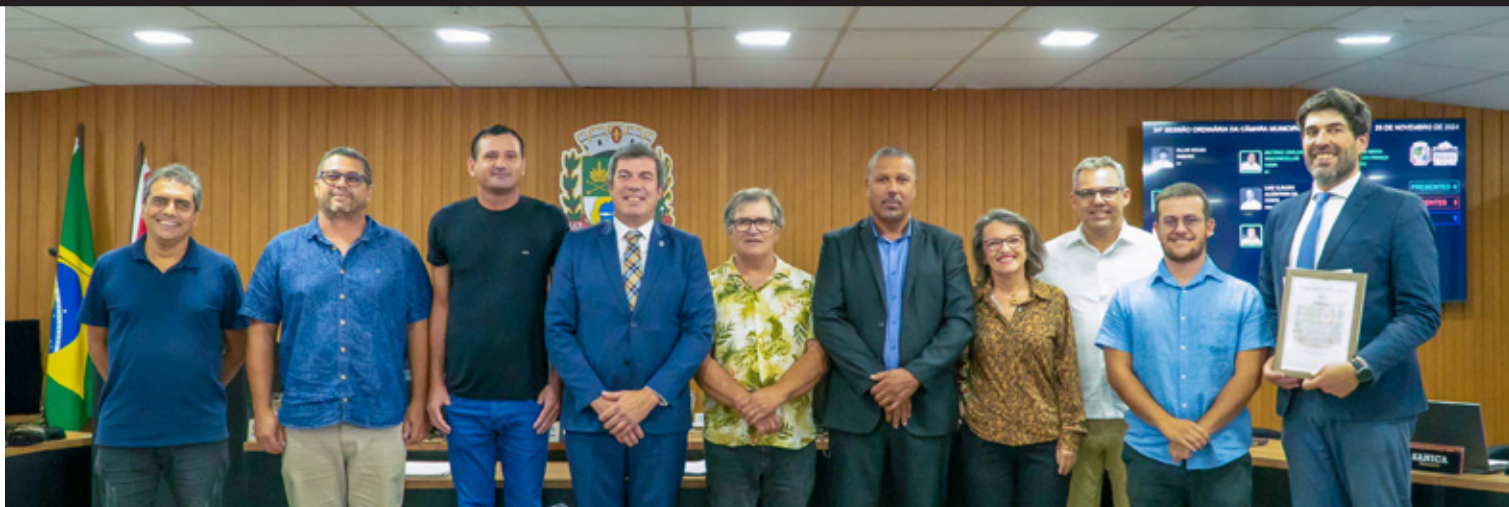
Câmara Municipal de Ílhavo, Prefeitura de Paraty e Câmara Municipal de Paraty