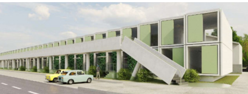
Habitação social na Gafanha da Encarnação, Simulação 3D

As Grandes Opções do Plano (GOP) apresentam um montante de 49.899.850 euros, representando 71% do valor global e capacitam a Câmara Municipal para a execução de investimentos na ordem dos 39.780.350 euros e para a concretização do plano de atividades em 10.119.500,00 euros.