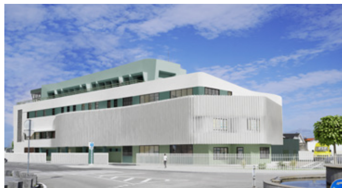
Centro de Saúde de Ílhavo, Simulação 3D