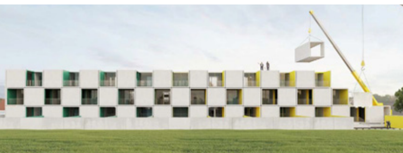
Habitação social na Gafanha da Nazaré, Simulação 3D