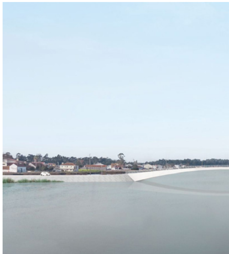
Ponte da Vista Alegre, Simulação 3D

No próximo ano, os Serviços Culturais, Recreativos e Religiosos surgem com uma dotação de 3,5 milhões de euros. No âmbito dos equipamentos culturais, é importante destacar os investimentos na manutenção dos edifícios e as empreitadas a realizar para a reabilitação do Museu Marítimo de Ílhavo, para o Cais Criativo da Costa Nova do Prado e o projeto de remodelação da Fábrica das Ideias da Gafanha da Nazaré.