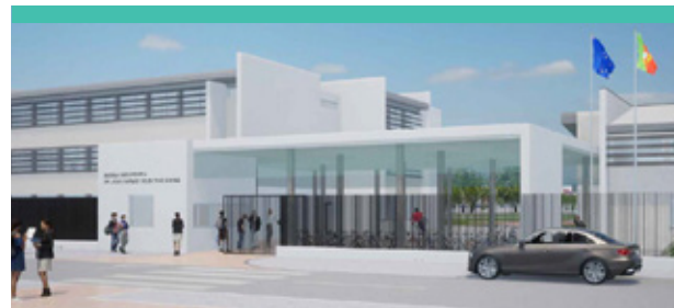
Escola Secundária Dr. João Carlos Celestino Gomes, Simulação 3D

O Orçamento Municipal para 2025, no que respeita ao Imposto Municipal Sobre Imóveis (IMI), dá continuidade à estratégia de alívio da carga fiscal com a redução da taxa para os 0,3% (prédios urbanos), discriminando-se, positivamente, os municípios que apostem na construção de edifícios energeticamente mais sustentáveis e contribuam para o desenvolvimento do mercado de arrendamento pela recuperação de imóveis devolutos ou degradados.